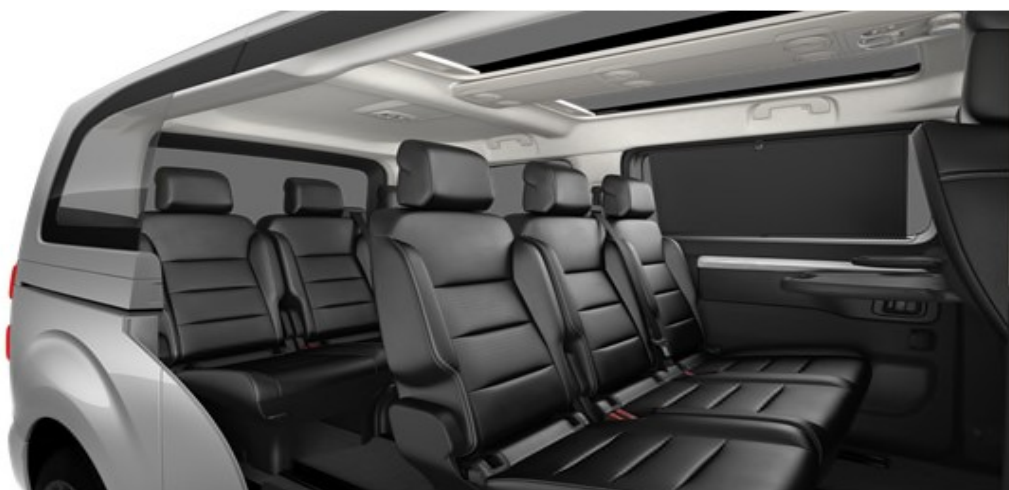
Кожа Claudia черна - код CYFX