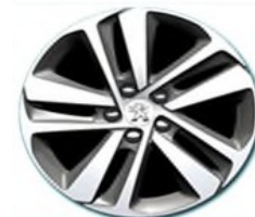
Алуминиеви джанти 17"