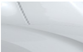
Бял Blanc Vanquise