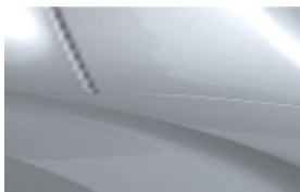
Сив Gris Artense