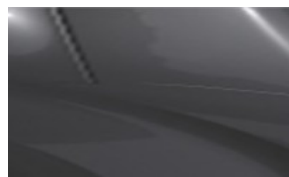
Сив Gris Platinum