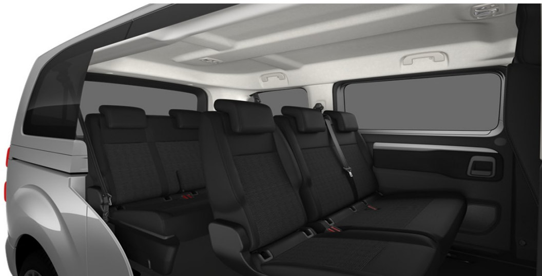
Текстил Tri-ton curitiba в черно и сиво - код 43FT