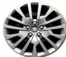
Тасове Full Cover 17"